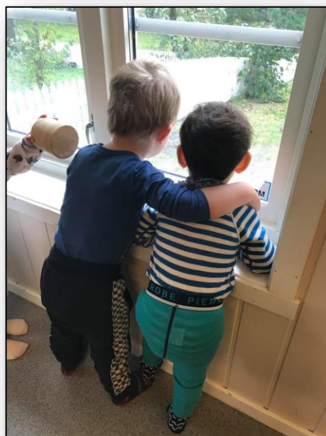
Gode råd på:

Fordelen vår i Dolstad barnehage er at vi er en relativt liten barnehage og har mulighet til å bli kjent med alle barna på huset, både når vi er ute og inne.